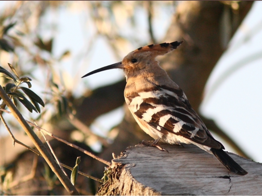
Upupa epops | Foto Latino R.