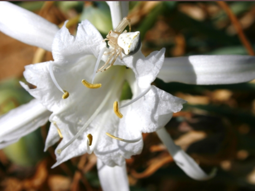
Pancretium maritimum