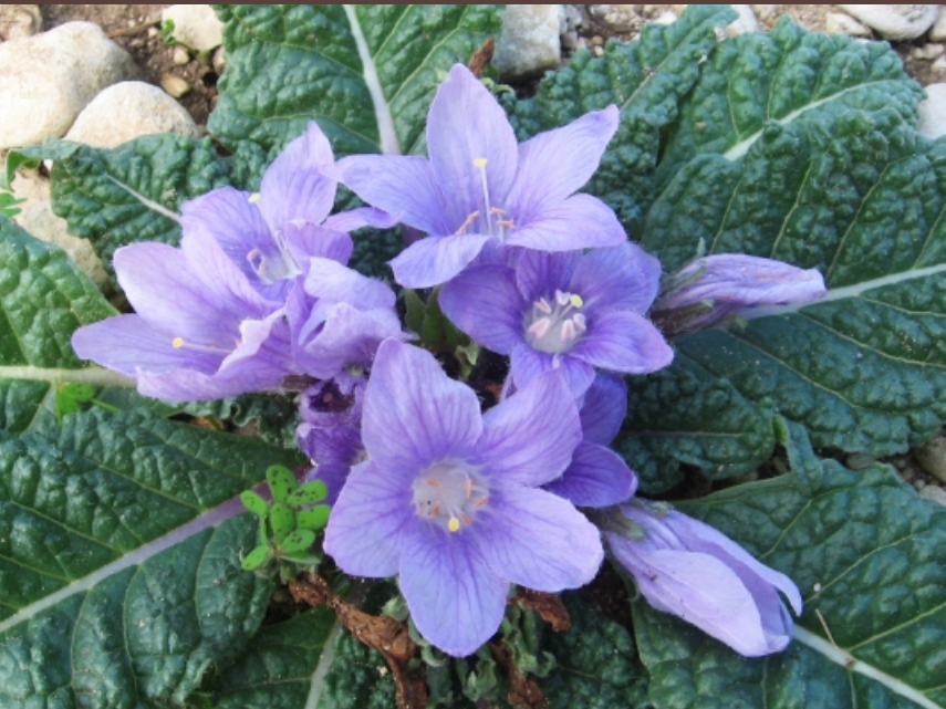
Mandragora autumnnalis