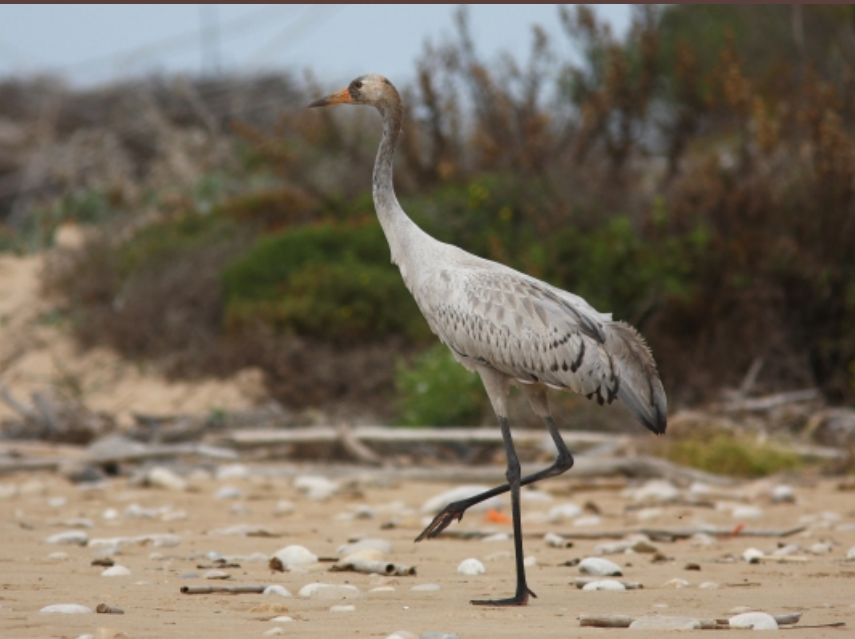
Grus grus | Foto Latino R.