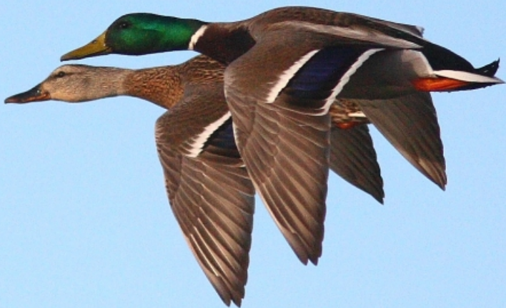
Anas platyrhynchos