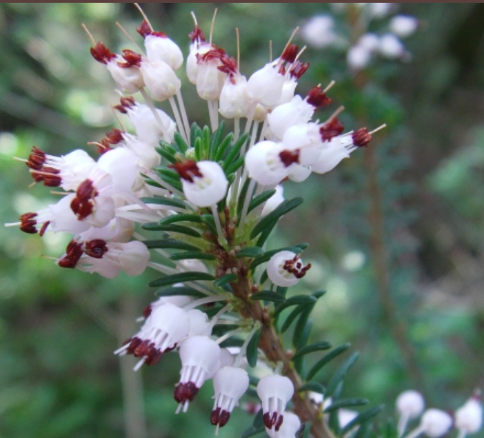
Erica verticillata