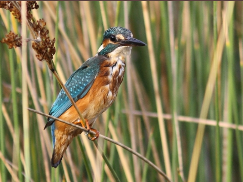
Alcedo atthis