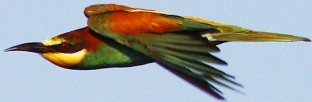
Merops apiaster